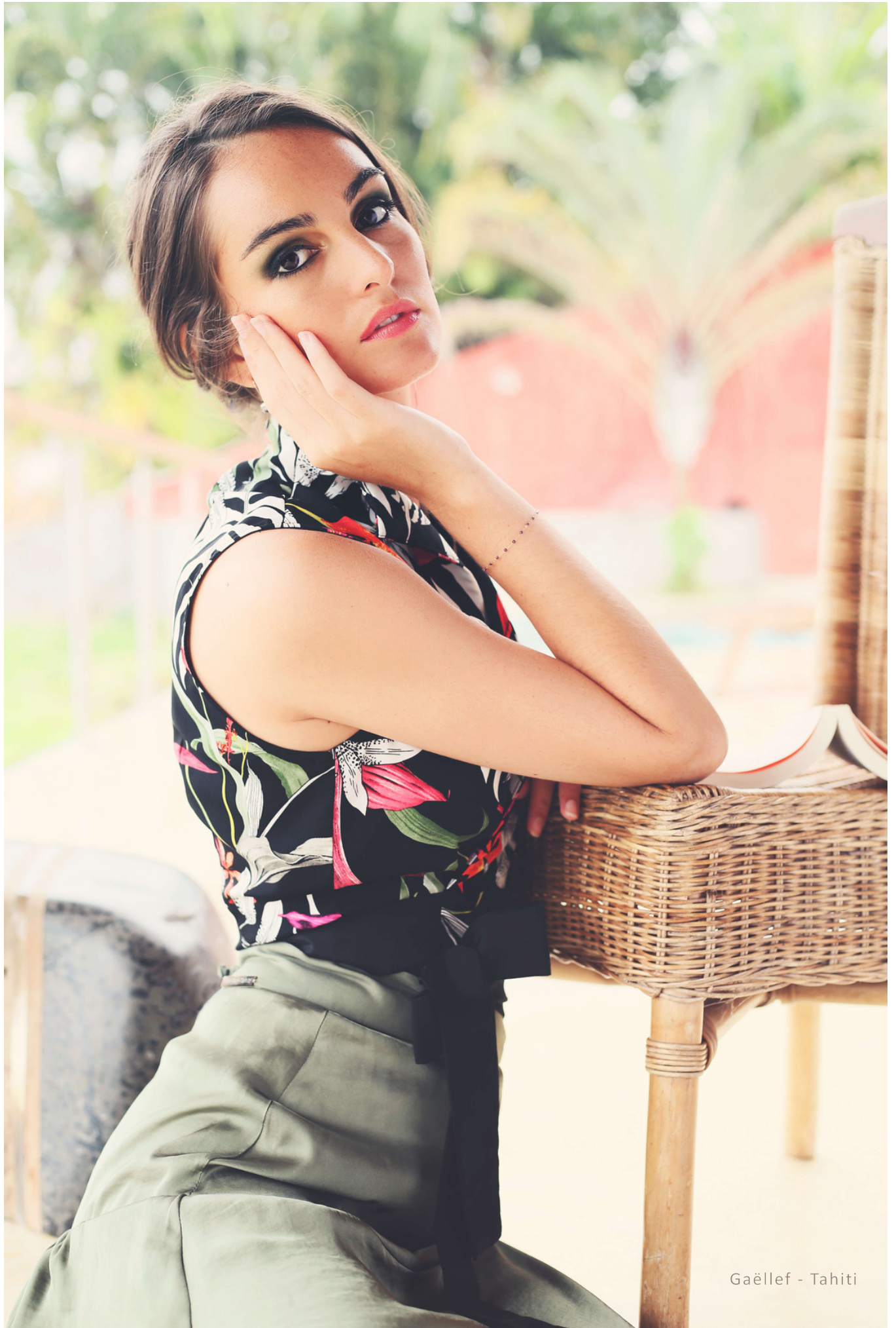
Gaëllef - Tahiti