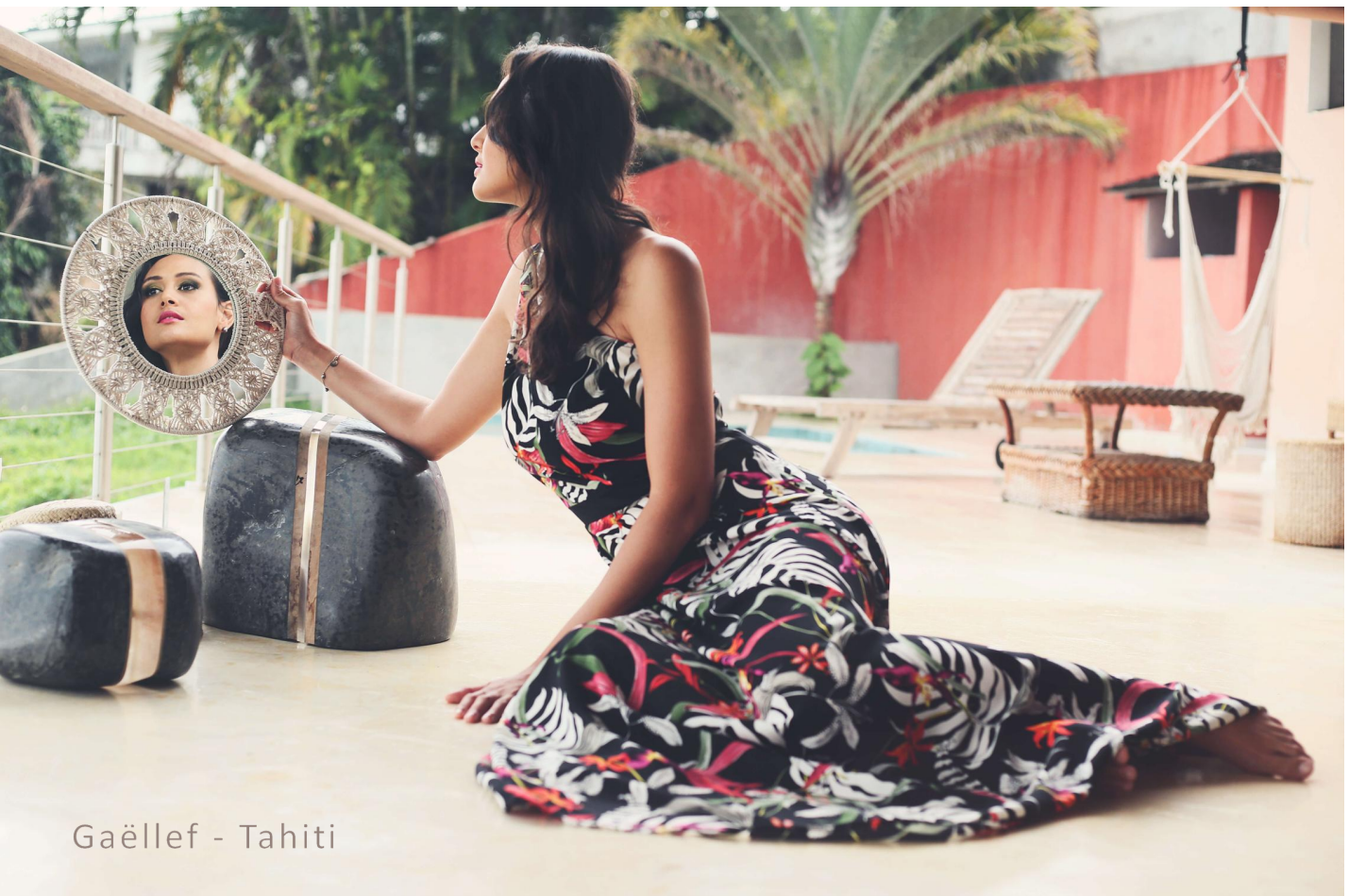
Gaëllef - Tahiti