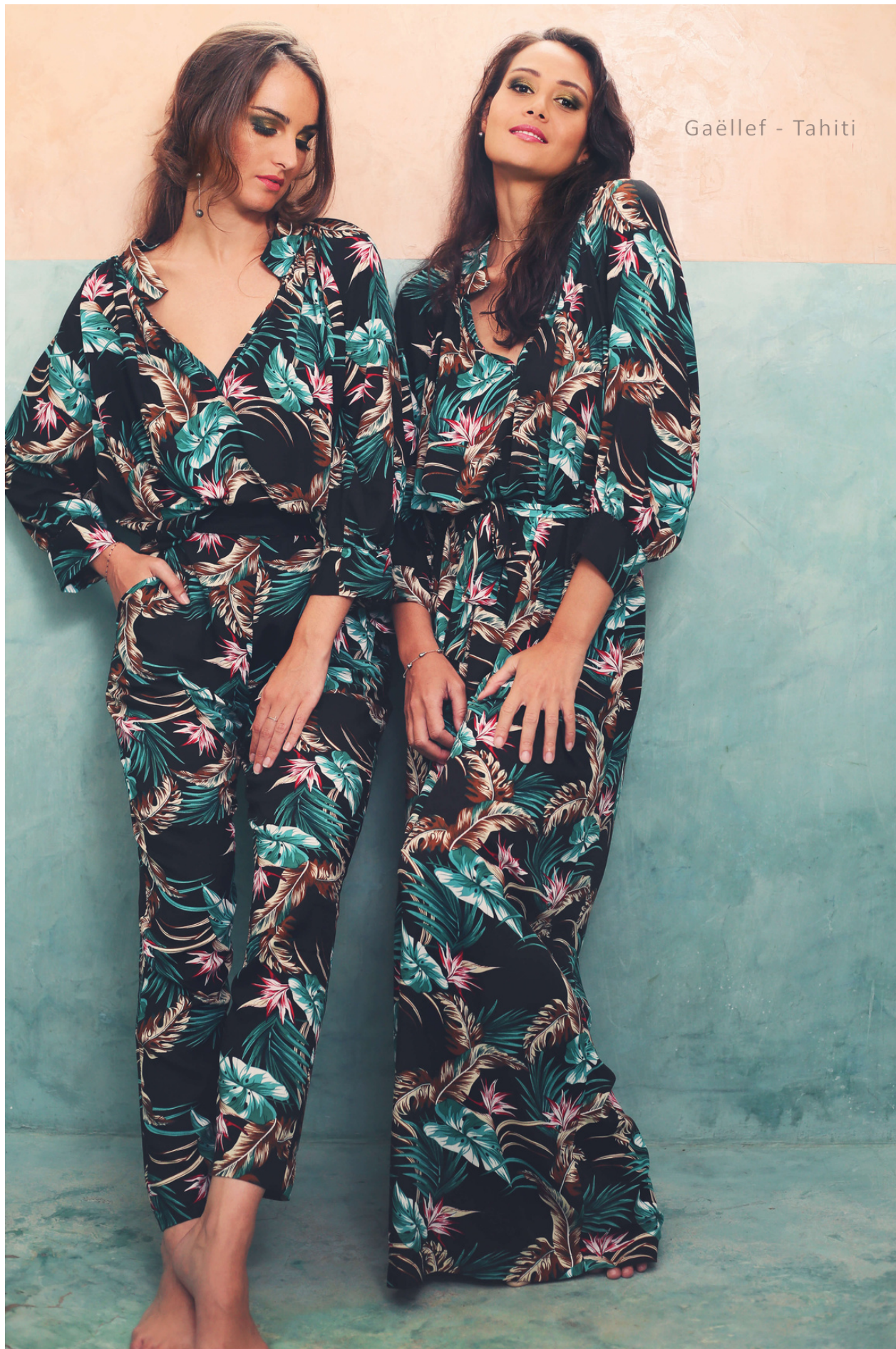
Gaëllef - Tahiti