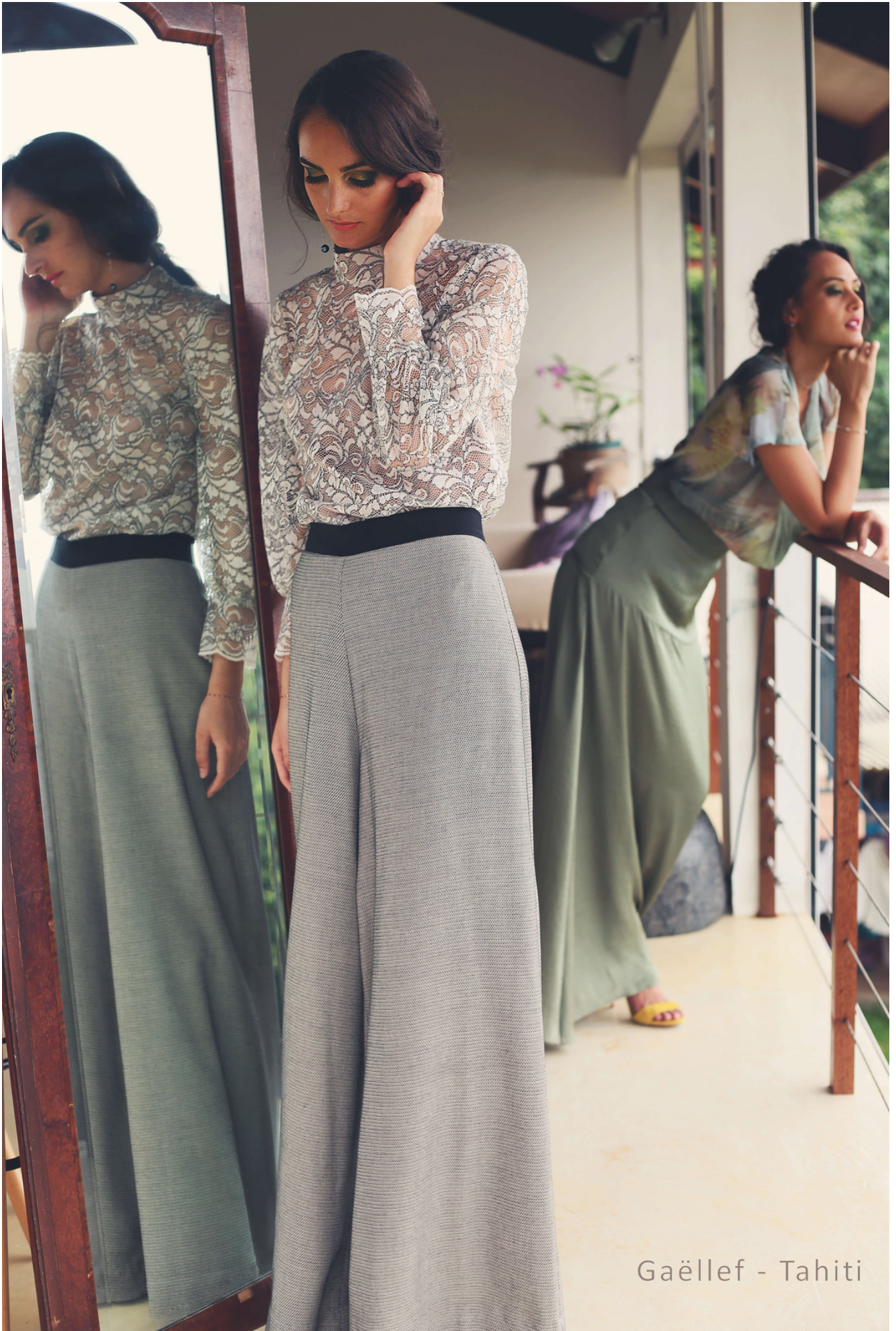
Gaëllef - Tahiti