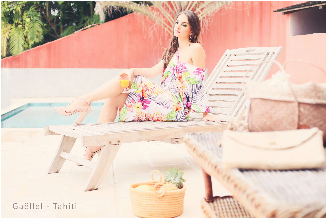
Gaëllef - Tahiti